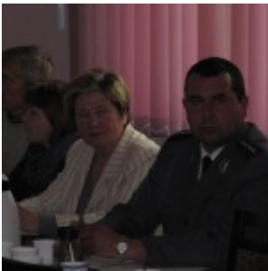
Sesja nr XIX