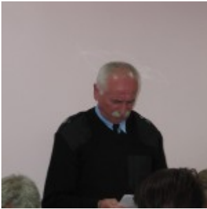
Sesja nr XIX