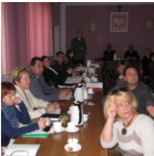
Sesja nr XIX