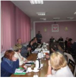
Sesja nr XIX