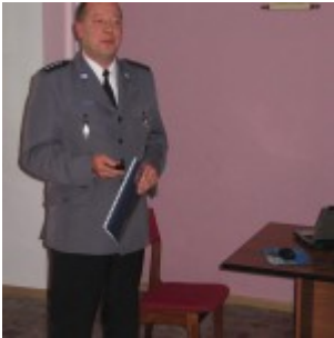
Sesja nr XIX