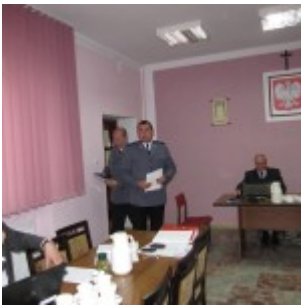
Sesja nr XIX