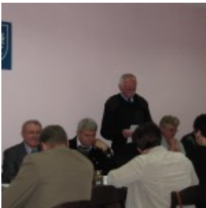
Sesja nr XIX