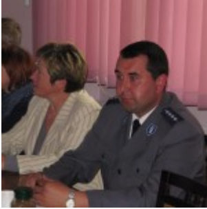
Sesja nr XIX