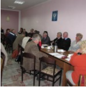
Sesja nr XIX