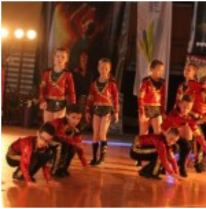
Sesja nr XIX