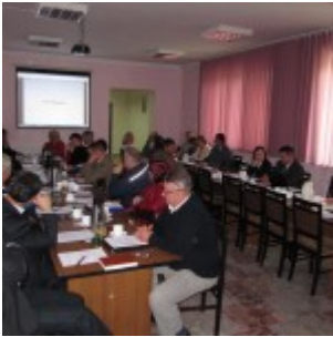
Sesja nr XIX