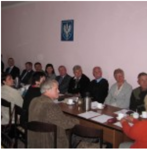
Sesja nr XIX