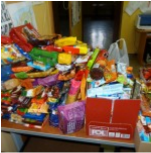
p1270443 – kopia