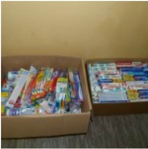
p1270464 – kopia