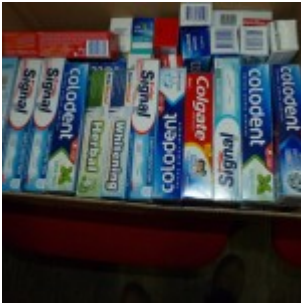
p1270441 – kopia