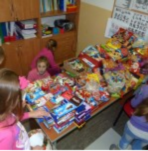
p1270452 – kopia