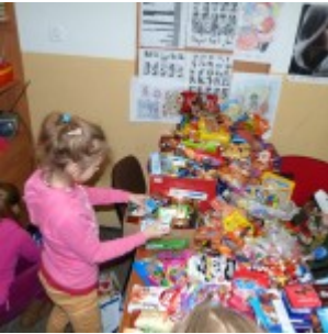
p1270453 – kopia