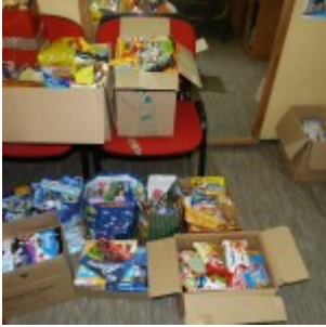
p1270463 – kopia