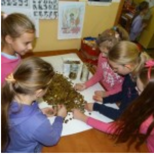
p1270462 – kopia