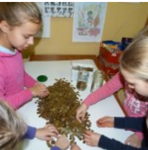
p1270457 – kopia