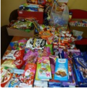
p1270442 – kopia