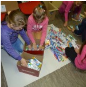
p1270446 – kopia