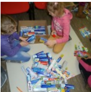
p1270450 – kopia