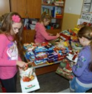
p1270451 – kopia