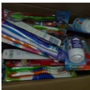
p1270439 – kopia