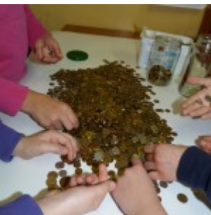
p1270459 – kopia